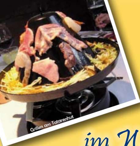
Grillen am Tatarenhut